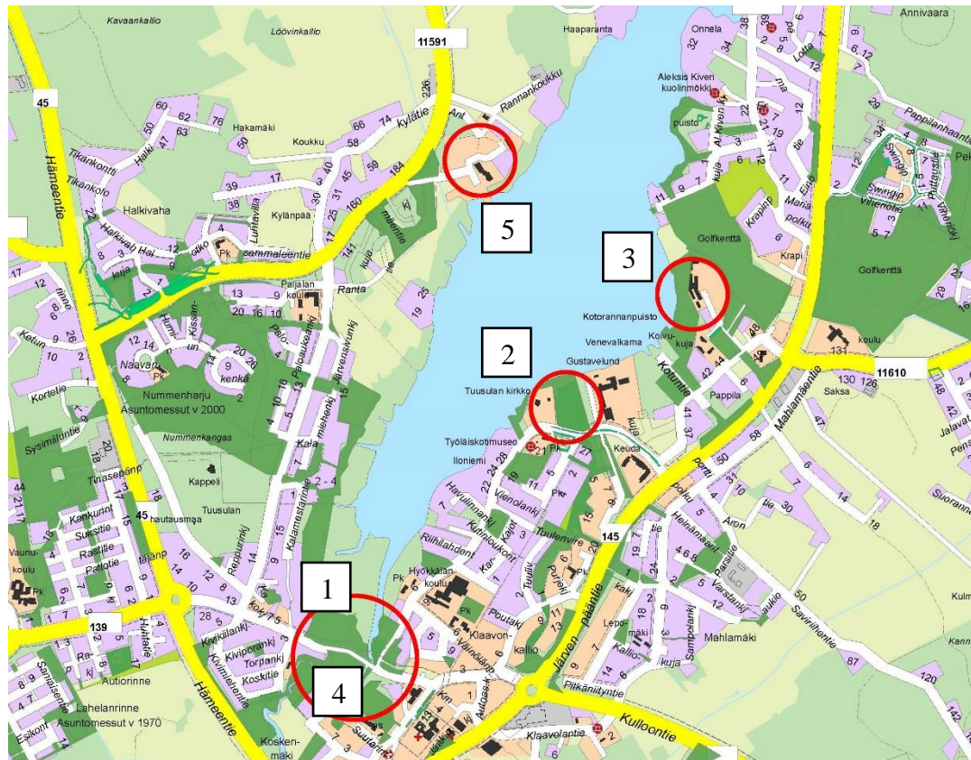
Kuva 1. Ensisijaiset kehityskohteet Tuusulanjärven rannalla vuonna 2017.

Uusien puistojen rakentamisessa on otettava huomioon, että niiden hoitoon on varattava riittävä lisärahoitus käyttöpuolen budjetissa tulevina vuosina. Viime vuosina kunnan säästötavoitteista johtuen viheralueiden hoitoluokittusta on jouduttu laskemaan, mikä on näkynyt yleisen viihtyvyyden heikkenemisenä.